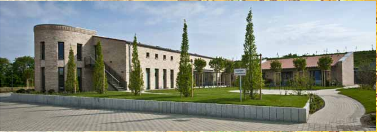
Ein Beispiel für wertvolle Hospizarbeit in Kiel: das stationäre Hospiz Kieler Förde in Kiel-Moorsee.

Interessierten Privatpersonen und Institutionen stehen diverse Möglichkeiten offen, sich für das Hospizwesen in der Region finanziell zu engagieren. 1 Neben Spenden direkt an entsprechende Einrichtungen und Initiativen wie die zuvor beispielhaft Genannten kann auch die Einrichtung eines eigenen zweck- und namensgebundenen Stiftungsfonds oder einer Treuhandstiftung eine interessante Option für ein dauerhaftes Engagement sein. Sprechen Sie einfach mit den Experten aus dem Stiftungs- und Generationenmanagement der Förde Sparkasse über Ihre individuellen Vorstellungen und lassen Sie sich beraten, welcher Weg am besten zu Ihren Ideen passt.