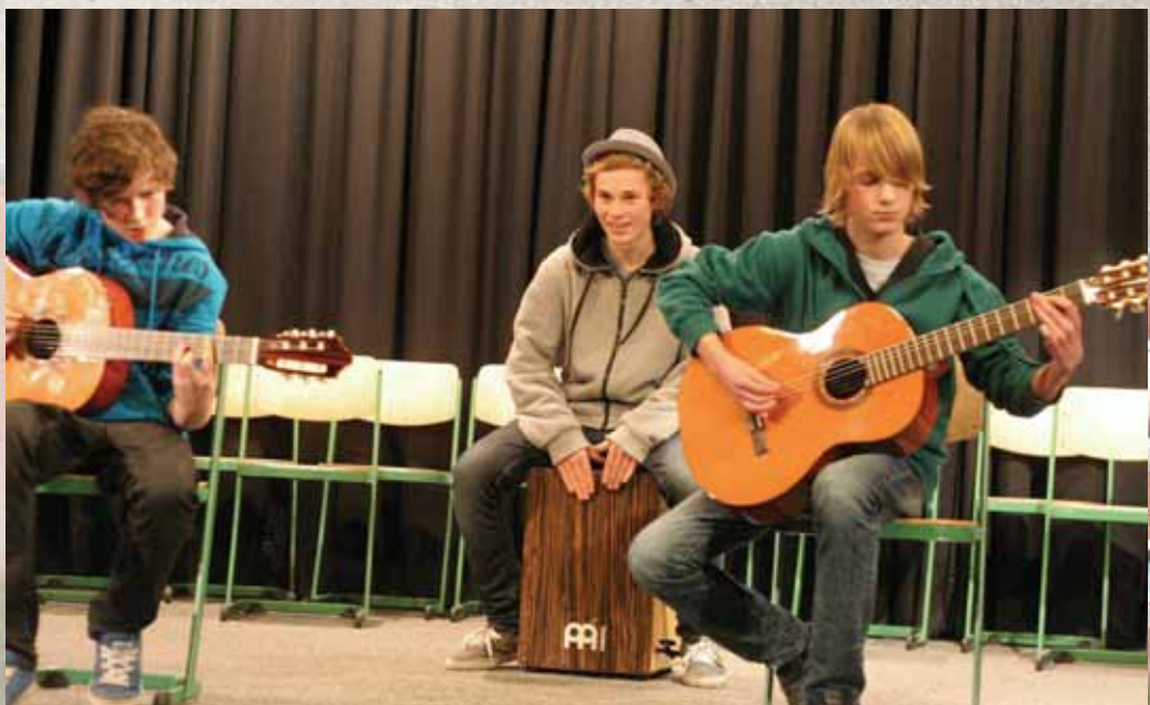
Musische Förderung: Gitarrenintermezzo

Informationen finden Sie auch im Internet unter www.stiftung.gymnasium-wellingdorf.de