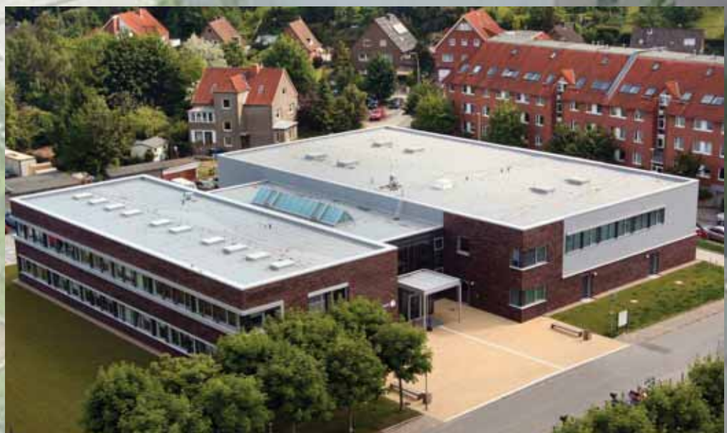
Ein wichtiges Element des Kieler Ostufers: der Campus der Fachhochschule Kiel in Kiel-Dietrichsdorf